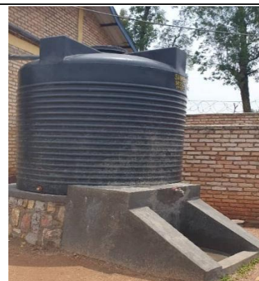
1 de 2 citernes Lycée de Rusatira (sept. 25)