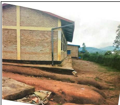
Erosion puis aridité Mugogwe (2024)

Les citernes ont déjà été livrées, nous venons d'en recevoir les photos ce 16 septembre.