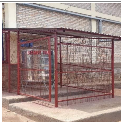
Eau potable EP Remera (sept. 2025)