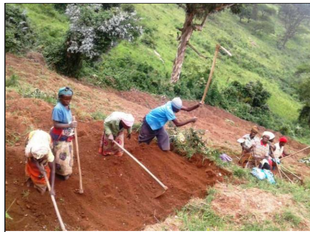
Labour collectif du champ d'un bénéficiaire

Ces actions ont de nombreux avantages, comme le logement salubre pour 19 ménages, la réalisation des travaux pénibles rapidement et facilement [photo], et le renforcement de la cohésion sociale, l'isolement ayant été combattu même pour les familles de 'cas sociaux'.