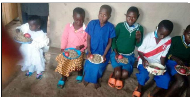
Bébé et enfants mangeant les repas préparés

De par cette activité, on a observé chez les bénéficiaires la diminution des maladies dues à la malnutrition, l'amélioration de l'état de santé des membres de la famille, la diminution des maladies diarrhéiques suite aux mesures de prévention, une progression vitale significative chez les personnes âgées, la promotion de l'intelligence chez les enfants en bas-âge grâce à une bonne croissance, l'acquisition des forces physiques chez les adultes pour accomplir les travaux lourds.