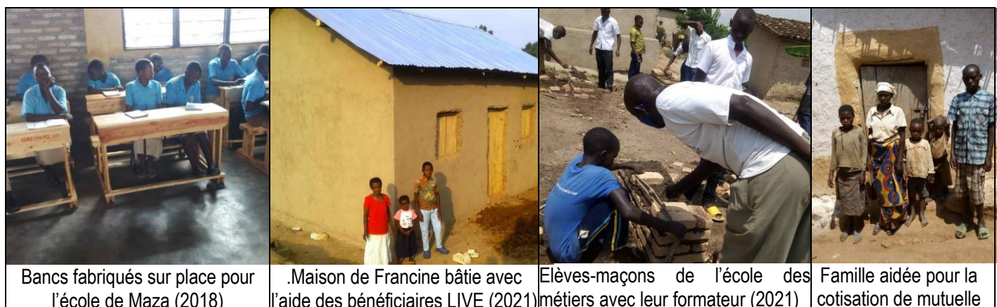
Bancs fabriqués sur place pour l'école de Maza (2018)

Les photos ci-dessous montrent quelques réalisations similaires de ces dernières années.