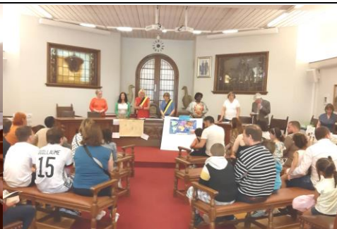
une assemblée variée et très attentive