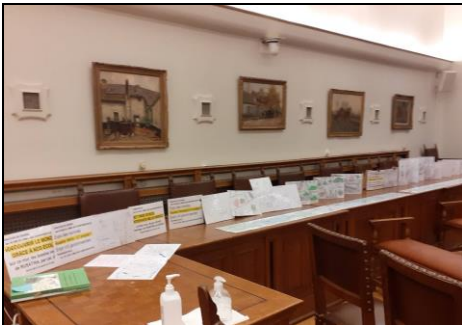
dessins des enfants du Rwanda