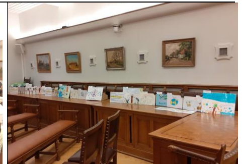
dessins des enfants de Ganshoren