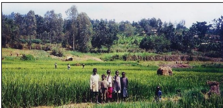
Marais de Rusatira : enfants chassant les oiseaux des champs de riz

Avant 1958, le marais de Ganshoren faisait 7% de la superficie communale, car Ganshoren possédait l'actuel "marais de Jette" (0,05 km 2 ) qu'il échangea avec Jette contre la parcelle du cimetière et du terrain de football actuels. Le nom de la commune "Gans-Horen" ou "marais (hoor) aux oies (gans)" rappelle d'ailleurs ce passé extrêmement marécageux au point d'y attirer les oiseaux.