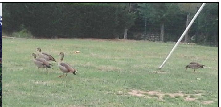
Marais de Ganshoren : les oies (du Nil) dans un pré près du marais

La nature, c'est un point commun entre Rusatira et Ganshoren : les marais sont un refuge pour une faune et flore spécifiques, et on y trouve des serpents - parfois vénimeux - dans les 2 communes. Mais on y trouve aussi des oiseaux et des fleurs magnifiques !