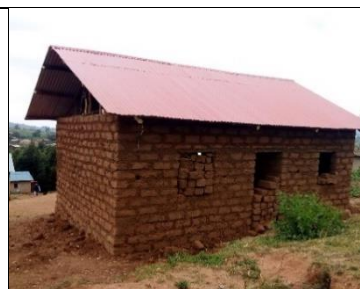
Maison d'Emmanuel, à Kiruhura (secteur Rusatira)