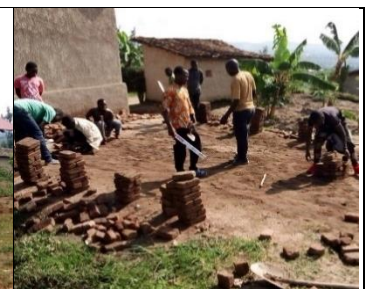
Travaux de maçonnerie à l'école de Nyarurama