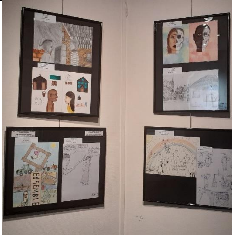
Les dessins primés au concours 2022 entre écoles de Ganshoren et de Rusatira étaient exposés