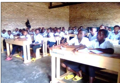
Pupitres (par 3 élèves), au groupe scolaire Kotana

L'école des métiers de Nyarurama (couture, coiffure, maçonnerie) a bénéficié de 2 appuis, qui seront finalisés seulement en 2023. L'un doit assurer 30 unités de formation (6 mois) pour des jeunes de familles démunies, dont le processus de sélection est achevé. L'autre a permis l'achat de matériaux pour agrandir une classe, par les élèves de la section maçonnerie.