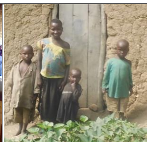
Famille aidée par la mutuelle de santé (Kinazi)